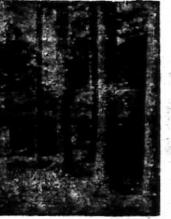
Phóng ảnh về người... (Caption describing the person in the photo)