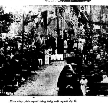
Hình chụp theo người đứng thấy mặt người... (Caption for the group photo)