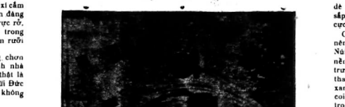
Hình chụp theo sự mời người...

Bữa trước thấy trong báo Lạc-Tin và Công báo... (Text provides details about the ceremony, mentioning the date and location)