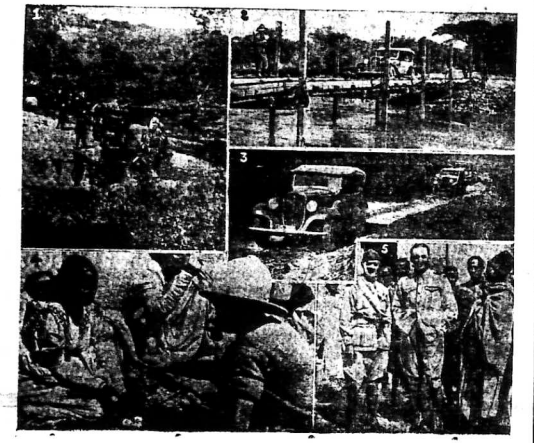
Sau khi tập thành Adana... Một tên quân Y... 3- Một tên quân Y... 4- Một tên quân Y... 5- Một tên quân Y...