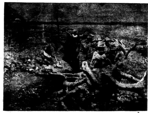
Mỹ Sa-may Ogađen, binh A lo phóng-thả bom... Binh A đả ra như chiến-hỏa mà làm nhiều... Binh trên đây chụp lúc binh A ở dưới chiến-hỏa ném bom chiến địa.

Vua xứ Yemen nói mình không khang giúp A CÁC XỨ CHỊU A-TRIỆU BẢO-HỘ GIỜ LẠI BỘI PHẬN Miền Ogađen biên thành biên cả