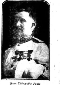
Quan Thợ-đé Pugé... Thiệt quan Thợ-đé mua thiệp làm sao, ngài đi khinh bỉ... Thiệt quan Thợ-đé mua thiệp làm sao, ngài đi khinh bỉ.

Nhà hát Tây Saigon có bảy cửa diễn trên sân khấu... Ông Bours là vua của đội Ballet de Langbassière thị hợp... Ông Bours là vua của đội Ballet de Langbassière thị hợp.