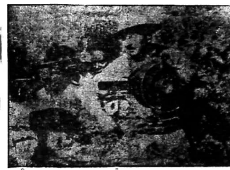
Ảnh của Paris-Bor Đuối chiến-hiến, binh Á tàn-tàn, chỉ có tàn-hư-sân-thay vì chợ nôm, chỉ có nhà gác phình hoi bóng lá dỏ, nơi cũ như in (tiếp trong hình).

Việc mà liệt-cường đã bảo Đức-quốc là tàn-bạo bất nhân Quanh thành Makallé, binh Á cứ đánh giặc chòm phá binh Y luôn luôn. Trỗi lại mưa như trức nước khiến cho Y phải dừng cuộc hành binh