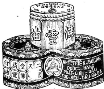
式圖面包齒璋坡大