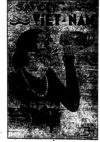
Bức vẽ của ông Phan-Sinh, Centre