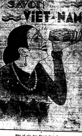
Bức vẽ của ông Thanh-Sinh, Bentre