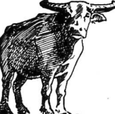
Chỉ cách lây bệnh Surra Trên đây là mô hình của lây bệnh surra...