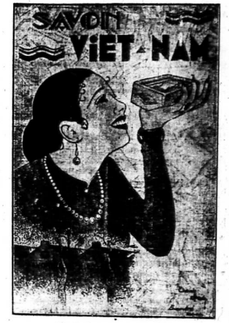
Bức vẽ của ông Thanh-Sinh, Bentre