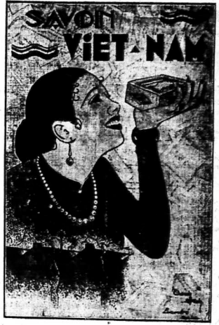
Bức vẽ của ông Thanh-Sinh, Bentre