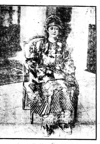
Nam Phương Hoàng Hậu

NAM-PHƯƠNG HOÀNG-HẬU ĐỨC BẢO-ĐẠI CHO NAN DÂN BIÊN-HÒA BA TRĂM ĐỒNG