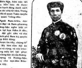
Đức Bảo Đại