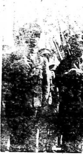
Xưa này, đời-giá thấy những tin tức này về cuộc xung-đột giữa Ý và Abyssinie.

Adis Abeba. - Các bên kia Abyssinie, từ từ vẫn chỉ đàm, ai cũng đều chú ý tới cuộc thương-thuyết ở Genève nhiều lắm.