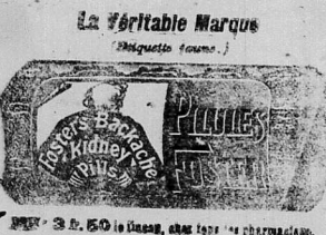
3 fr. 50 la boîte, chez tous les pharmaciens