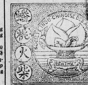
Hộp quẹt này khắp nơi đựng phép bán là một su nhỏ một hộp mà thôi.

Vậy nên hút thuốc chớ bán hiệu COO, hiệu SCAFFERLETTI; thuốc đá vàng hiệu COO, FAVORITES, ADLÈS, v. v. cũng những xi-gà hiệu MANDARIN, BOUQUET, LORUS, và NARCISSE là những thuốc của ĐÔNG-DƯƠNG YÊN-THẢO CÔNG-TY chớ ra. Hút thuốc ấy tức là giúp đỡ người đồng-bang trồng thuốc, và chớ thuốc ấy, mà lại giữ được tiền bạc không mất ra ngoại quốc vậy.