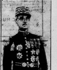
Quan Toàn-quyền Catroux