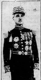
Quan Toan-quyến Catroux... Sáng hôm rđ, 21 đả 7 giờ, hai « trợng » Toan-quyến Catroux đã có máy bay tu giả Hanoi bay vào đợm xem cuộc tập trận lớn này... Sáng hôm rđ, 21 đả 7 giờ, hai « trợng » Toan-quyến Catroux đã có máy bay tu giả Hanoi bay vào đợm xem cuộc tập trận lớn này...