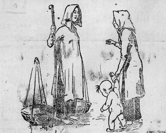
— Cha chả! Con có sữa dũ hê! — Là tại mỗi ngày tôi cho nó uống sữa hiệu LA PETITE FERMIÈRE.

Trả Huê tinh anh (hạ giá): Thứ thượng hạng, một yên... 2900 Thứ nhì hạng, một yên... 4 20 Thứ nhì hạng, một yên... 4 00 Trả Ninh thái... 0 60 « ướp sen... 0 40 Trả hiệu Trung-quốc, 4 lượng... 0 60