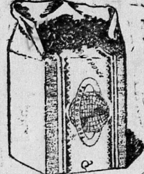
Có một mình hãng Denis Frères trẻ thuốc này mạnh hê!