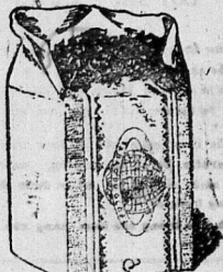
Có một mình hãng Denis Frères thuốc này mà thôi.

(N. 4) FEUILLETON DU 29 AOUT 1918. MẠNH-HÀNG TÂN TRUYỆN (Roman moderne) PAR TRAN-THIEN (Tiếp theo) Ông vào nhà-thương rồi, thường bữa tới đường qua lại, đem cho con bánh trái nuôi chúng, có đó đâu, mà đặc lời, qui đem đàng.