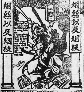
NGUYỄN-BERHET, CHARRIÈRE & C o