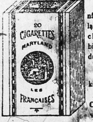
thể thử rồi thì tra nó luôn luôn.

Đơn lại nước Languedoc. Dạng sữa thường hàng trong hoàn cầu, vẫn vẫn. Sức khỏe, Mạnh mẽ, vẫn vẫn. Sữa đất Normand hiệu La petite fermière đơn tại tỉnh Normand địa trong Bô Wolle de Bray đơn một cách rất kỳ công, tuy làm ra đắt mà tinh chất hay còn