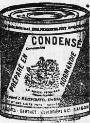
nhỏ hơn trái sách, Bê xứ Normand tự thú này có danh, anh sáng sủa thường hàng và qui hơn trong cả hoàn cầu.

JAN Lục-Tính-Tân-Văn. Ngọc-hạp 1916 thiết giá 0 $ 20 (không phải 0 $ 40). 2° Tiên-cán-báo-hậu thứ 8. 0 30 3° Tường Lục-vân-Tiên... 0 30