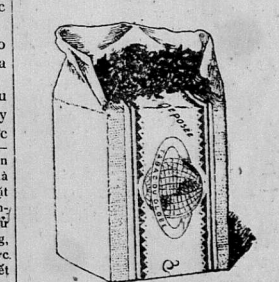
Có một mình hãng Denz Frères từ thuốc này mà hàng.