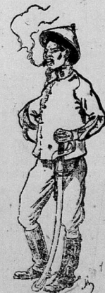
Thầy dọi này hút thuốc hiệu HONGROISES' như ông Quan-ba bốn-cơ vậy.