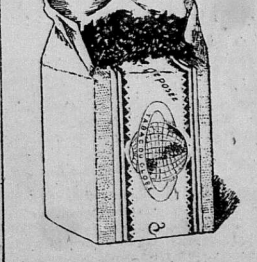
Chỉ một mình hãng Denis Frères trữ thuốc này mà thôi.