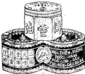
式圖面包畫標波大