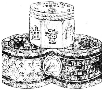
式圖面包畫請認大

PHẬT-LINH-DẦU HAY LA DẦU-BÙ-ĐÀ Hộp 100 gr 0.10 Thế kỷ các 0.20