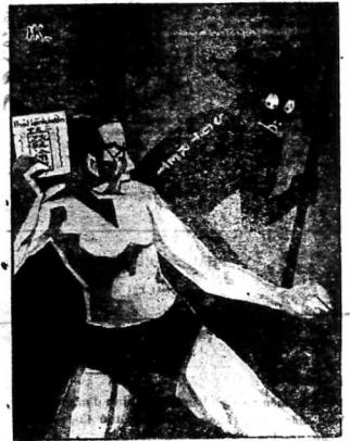
TRẦN HIỆU PHÁT LÀNH HỒN của Nhị-Thiện-Dưỡng...