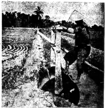
hình xe quạt nước của người đẹp.

THUỐC TẮC: Đường đi ngang qua trung tâm một thửa ruộng 18 mét. Bề dài cái máy 1 thước. 55 công suất nước. 8. Xe quạt nước làm bằng cây sắt, cái cốt hình xe bằng cây sắt.