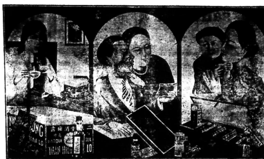
1- Tiêu-ban-lộ chỉ có thể Tiêu-ban-lộ của Nhị-Thiên-Đương Đương là trị tinh các chứng bệnh ma bô. 2- Vạn-Đương Nhị-Thiên-Đương là một thuốc viên dễ nuốt, cứu cấp phá nguy, nâng đỡ bệnh biện nghiệm như thần. 3- Vạn-Đương Thôi-nhiệt-Đương của Nhị-Thiên-Đương có sức nóng khí, hoạt huyết, xung huyết, phong và trị lạnh trở chế bệnh rét mướt.