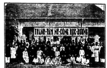
Đây là hình các cô giáo và học-sinh trường Nữ-Công Thanh Tâm. Đay giá rẻ, học mau thành thạo. Trường mới mở thêm khoa dạy dệt thêu dệt hàng, dệt vải và khoa dạy đàn piano, mandolin, o ba và Marie, Anna Trường-vinh-Tống dạy mới tháng 5.

Thanh-Tâm Nữ-Công Học-Đường Dạy đủ các môn công-nghệ và Pháp văn 201-16 Gallieni N° 227 & 231 - SAIGON