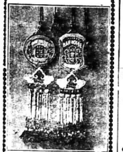
Savon VIỆT-NAM đánh đổ các thứ savon khác vì nó thật tốt

Làm và làm khước bại, Hưng chức Nam Bộ T các làng. Kh. khước bại, Chánh-phủ cũng nhận theo chức-tri số 173 ngày 28 Mai 1934 và có chức trong lại. ngày 27 tháng năm 1934. ở Kim-Tiến, và Kim-khánh. Cho mượn và sửa máy viết. Làm bản đồ bộ bia khác soon đây.