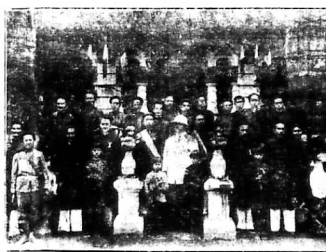
Đội đờng rắng Bồn quan ban khen Hương-chức làng Phan-phước, vì lòng sốt sán, tên tâm điều đình trong việc thầu thuê năm 1934.