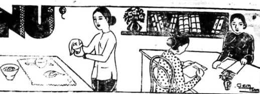
Nét mặt hương hoa.

Bà Perreux đã hiến tặng cho tôi... (Text continues with a letter or poem)