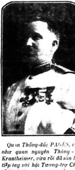
Quản Thống-đốc PAULEN, cũng như quan nguyên Thủ-đốc Kraemerhiser, xưa rồi đã từng làm Tổng-tập kỳ yêu Hội Trưng-trợ Chân-Tê Xã-Hội.