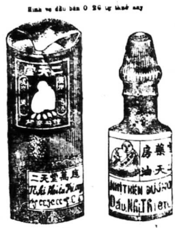
Hình vẽ dầu nhỏ bán 0$10 - 4p ra đời

Khắp cả Đông-Pháp, ai ai cũng đều biết thứ Vạn ứng Nhi-thiên-dầu của tiệm thuốc Nhi-Thiên-Đương ở tại Cholon đường Canton số 47 chẻ ra ra thân hiệu và cần sếp cho mọi người hơn hết. Giá chỉ bán có 0$26 một ve mà thôi. Nay nhân lúc đồ khô, nhiều người túng ngặt, kiếm chẳng ra tiền. Vì sự ích lợi chung nên tiệm Nhi-Thiên-Đương mới chẻ ra Vạn ứng Nhi-thiên dầu ve nhỏ cũng y một thứ dầu trong ve 0$26 bán từ thuở nay vậy, chỉ bán 0$10 một ve. Tương với giá đồ người nghèo cũng có tiền mua nó mà dùng trong cơn hữu bệnh. Thứ dầu này để trong mình cho thường, nó chủ-trị về bá hừng rất hay, dùng nó mà cứu-cấp những bệnh thình lình thì công hiệu lắm. Trong hạ tuần tháng ba này này thì có thứ Vạn ứng Nhi-thiên-dầu ve nhỏ ra đời nên Nhi-Thiên-Đương xin cho quý vị hay biết trước, đừng để lỡ chực y đó mua về sẵn mà dùng.