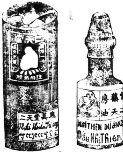
Hình ve dầu nhỏ 0.26 và 0.10