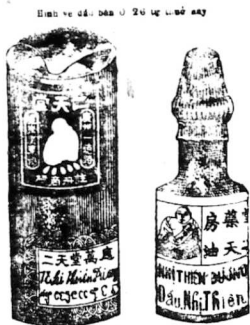
Minh ve đầu nhỏ bán 0'10 4p ra đời

Khắp cả Đông-Pháp, ai ai cũng đều biết thứ Vạn ứng Nhi-thiên-dầu của tiệm thuốc Nhi-Thiên-Đương ở tại Cholon đường Canton số 47 chế ra là thần hiệu và cần ích cho mọi người hơn hết. Giá chỉ bán có 0'26 một ve mà thôi. Nay vì làm lúc đồ khô, nhiều người túng rứt, kiếm chẳng ra tiền. Vì sự ích lợi chung nên tiệm Nhi-Thiên-Đương mới chế ra Vạn ứng Nhi-thiên-dầu ve nhỏ cũng y một thứ dầu trong ve 0'26 bán rẻ thườ nay vậy, chỉ bán 0'10 một ve. Trường với giá đó người nghèo cũng có thể mua nổi mà dùng trong cơn hữu bệnh. Thứ dầu này để trong mình cho thường, nó chủ trị về bá bệnh rất hay, dùng nó mà cứu-cấp những bệnh tình lành thì công hiệu lắm. Trong hạ tuần tháng b3 tây này thì có thứ Vạn ứng Nhi-thiên-dầu ve nhỏ ra đời nên Nhi-Thiên-Đương xin cho quý vị hay biết trước, dặng đến chừng đó mua về sản mà dùng.