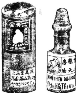
Hình ve dầu bán 0.26 và loại nhỏ