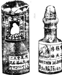
Hình ve dầu bán 0 26 tự thườ nay