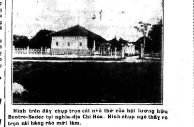
Hình trên đây chụp tron cái nhà ở của hội lương huê Centre-Sadee tại nghĩa-địa Chi-Hoa. Hình chụp này đờ trên cái hàng rào mới làm.

TIỀN... La một học... Đàng-banc... 12000... 6.00... 6.00