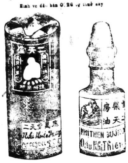
Hình ve đầu bán 0.26 tự thuở nay

Trong hạ tuần tháng tư này thì có thứ Vạn ứng Nhị-thiên-dầu ve nhỏ ra đời nên Nhị-Thiên-Đương xin cho quý vị hay biết trước, dặng đèn chầu đầu mà mua dè sản mà dùng.