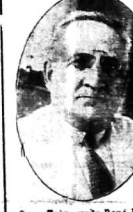
Quan Toàn-quyền René ROBIN

Quan Toàn-quyền Robin cũng các vị thường quan mới bỏ sang để lên tôi bỏ rồi, và không chấp quan Toàn-quyền đương tiếp-kiến các vị đại diện cho sự này và quan lại.