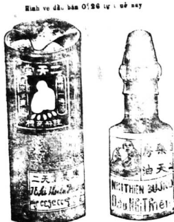
Hình ve dầu nhỏ bán 0$26 tựa cũ nay