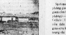
Đây là một chợ-phận rất đẹp, nó là một chợ-phận rất đẹp, nó là một chợ-phận rất đẹp.

Hãy dự Chợ-phận Thủ-dầu-một. Đây là một chợ-phận rất đẹp, nó là một chợ-phận rất đẹp, nó là một chợ-phận rất đẹp.