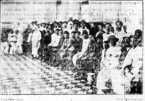
Trong phòng ngời đợi