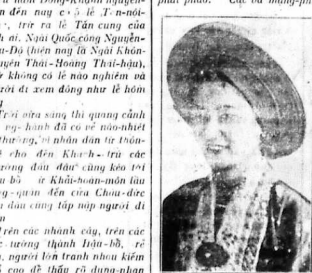
Hình Hoàng-hậu mặc lễ phục, chỉ khăn trắng.

Hình chụp bà Hoàng-hậu mặc đồ Triều-phúc. Hình ảnh của bà Hoàng-hậu mặc đồ Triều-phúc.