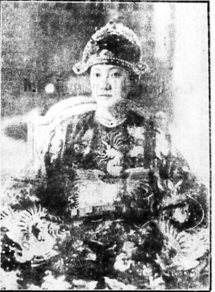
Hình chụp bà Hoàng-hậu mặc đồ Triều-phúc.

Nhà và việc đại lễ về cuộc lần-phong Hoàng-hậu vào Đại-nội. Các bà phủ-thiếp, mạng phụ Nam-triều đều đến lau công-quần trước Hoàng-hậu vào Đại-nội.