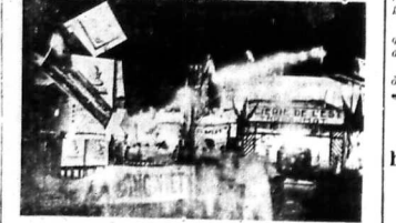
Hình trên đây là hình gian-hàng của hãng «Scierie de l'Est»... Hình trên đây là hình gian-hàng của hãng «Scierie de l'Est»...