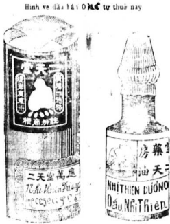
Hình vẽ dầu Nhị Thiên Đường

Trong hạ tuần tháng ba tây này thì có thứ Vạn ứng Nhị-thiên-dầu ve nhỏ ra đời nên Nhị-Thiên-Đường xin cho quý vị hay biết trước, đừng đểa chứng đó mua về sản mà dùng.