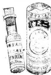
Hình vẽ dầu Nhị Thiên Đường

NHỊ-THIÊN-ĐƯƠNG 47. Rue de Canton, 47 -- CHOLON