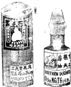
Hình ve đầu là 0940 cho tự nay