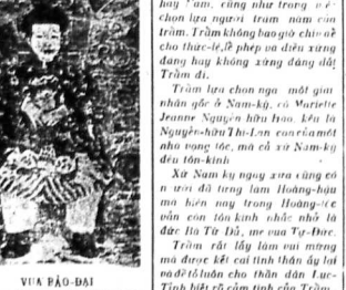
VUA BẢO-ĐẠI lúc còn nhỏ, mặc triều phục Đông phương thời xưa

Chứng từ đáng tin của Hoàng-tôn lập luận về ngụ-sinh hiện có hạn độ đã hết rồi. Sự duy trì của thuế tin lập luận đáng tin cậy của 55 ngày 21 tháng giêng năm Bảo-Đại thứ chín (6 Mars 1934), của đức Bảo-Đại.