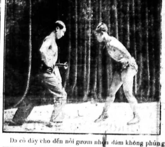
Bà có đây cho đến nỗi gớm ghê lắm không phùng