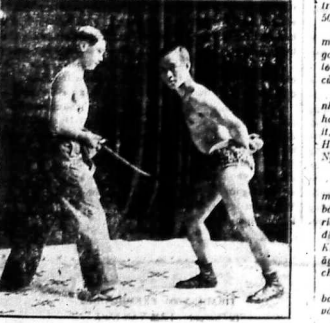
Đam lòng bụng mà không biết đau đớn gì hết.