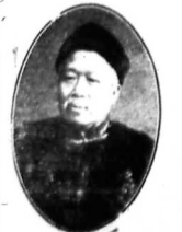
Có thể thấy trong bài