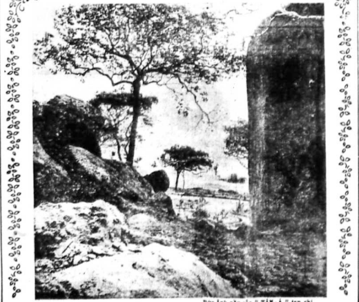
Độc khách này của 'TÂN-A' tạp chí