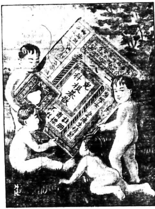
Đôi ông qui bà ở nhà nhỏ. Thăm nhi khoa Tân Cơ Tân, của Nhi-Thiên-Phong...