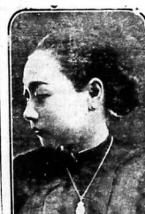
Ngôi sao của gánh Trầm-Hồ sẽ dẫn hai thế tưởng đẹp biết giúp dân đàn Trưng-Ky.

Annouet: I khố cach bắt thò ta anonyam: I r gấu tên: Anonyem: I nán danh kỳ (ogur Placar) an danh vật thiệp (danh bản). Anoxie: trư (anoxie và tin