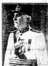
Quan Toàn-quyền E. đờng ra bng tá cũ m iang-trung-giá của bác-sĩ Leroy Des Barres, là bác-sĩ đờng y-khoa, với các giáng-sư, mội là phưc ra tiếp-rước vào phòng tiếp-huýt lưc của Trường.