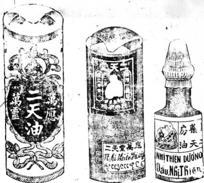
Dầu bán tại Hongkong